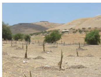
Plantations juin 2013 près de la source

Ceux qui ont survécu (150) sont en bon état mais en retard de développement pour un certain nombre. Un programme pour aider les fermiers va être mis en place début 2015 avec un accompagnement sur place.