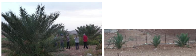
2 parcelles à Al Malih plantées en 2012

Ceux qui ont survécu (150) sont en bon état mais en retard de développement pour un certain nombre. Un programme pour aider les fermiers va être mis en place début 2015 avec un accompagnement sur place.