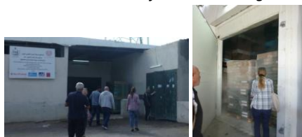
Entrée de la chambre froide et stockage