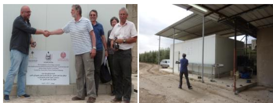
L'inauguration en 2011 et la chambre froide terminée (2012)