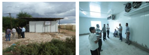
Chambre froide à Jiftlik : extérieur, intérieur vide et avec boîtes de dattes

Sur le programme 2012/2014 il reste à réaliser une petite chambre froide.