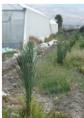
Dernières plantations 2014

- Notre partenaire PFU ayant décidé de recentrer ses activités, c'est Ma'an qui assure la suite du programme. Les difficultés rencontrées dans la région d'Al Malih nous ont entraînés à aller plus au sud de la vallée.