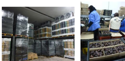
Stockage des dattes dans la chambre froide (partie financée par l'AFPS) et triage des dattes

Nous constatons qu'une capacité de 20 T pour une chambre froide est limitée pour profiter à plusieurs fermiers. Nous optons pour 60 T ce qui correspond financièrement à deux chambres froides de 20 T.